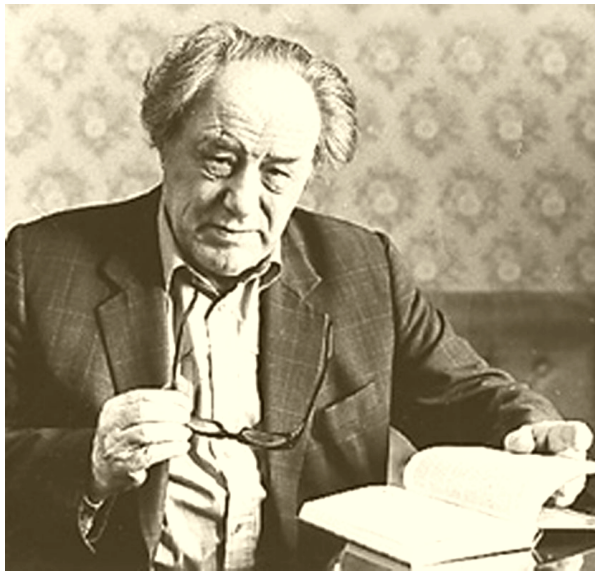
Никита Николаевич Моисеев (1917—2000)

Тема цивилизации, русской цивилизации образовалась на закате жизненного пути Моисеева. По-видимому, ученый не был хорошо знаком с христианским космизмом, который мог бы многое ему дать в анализе русского культурно-исторического типа. Впрочем, он прочел ряд работ славянофилов, евразийцев, Н.Я. Данилевского. Последние годы жизни, тревожась о судьбах России и русской цивилизации, Моисеев провел в общении, и, нередко, в спорах, с Александром Панариным (в котором он, очевидно, обрел друга, несмотря на то, что Панарин был значительно моложе, впрочем, ушли из жизни они практически одновременно).